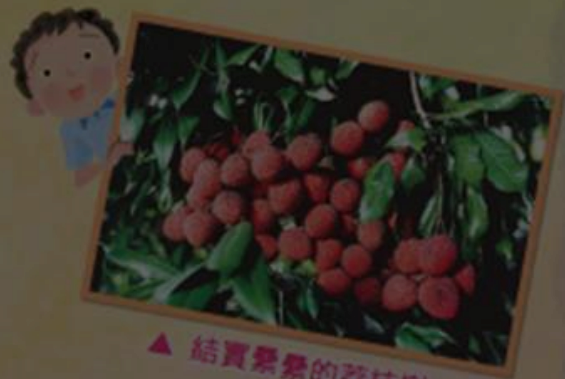
▲ 結實累累的荔枝樹